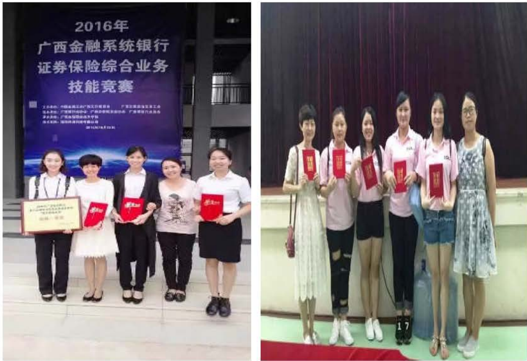
图8 企业技能选手参加比赛获优异成绩