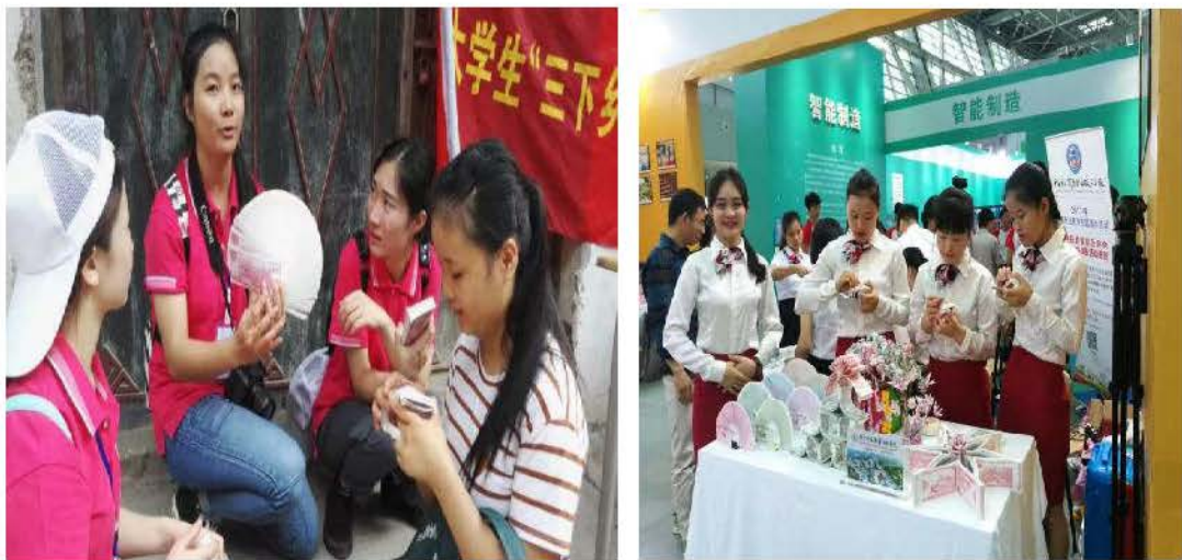
图8 企业技能选手参加比赛获优异成绩

结合大学生“三下乡”活动，组织工作室成员参加送技下乡活动，为乡村群众展示点钞、识钞技艺，为群众普及人民币知识以及真假钞辨别技术。