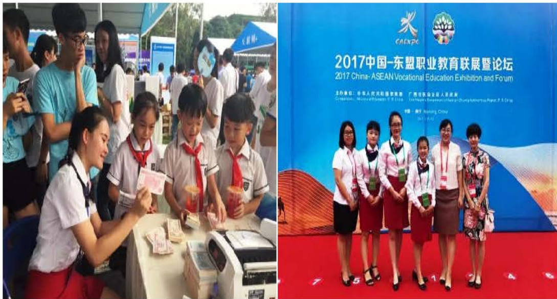
图1 工作室成员在2017中国-东盟职业教育联展暨论坛上的技能展示

2016-2018年，“蔓延金手指工作室”的指导教师及学生参加东盟职业教育展示中，以其精湛的技能征服国内各方嘉宾，所制作的作品得到领导和嘉宾的赞扬和认可。