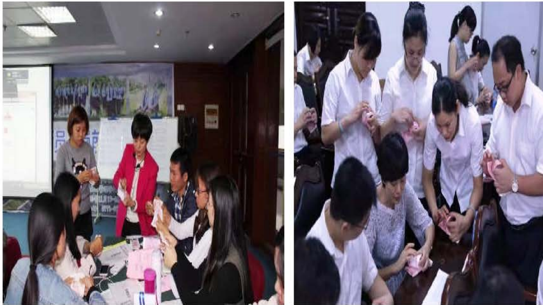
图7 为企业训练技能选手